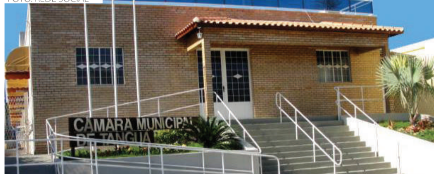
Audiência pública aconteceu no prédio do Legislativo municipal