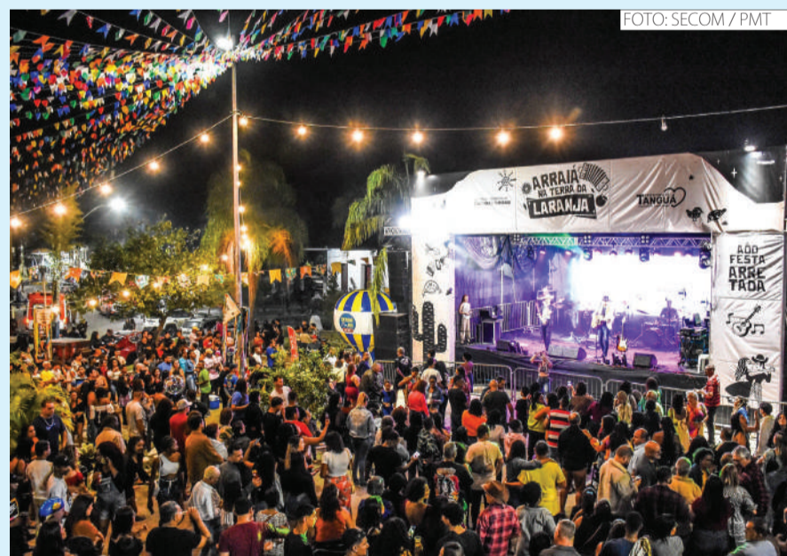
Evento aconteceu na praça central da cidade, celebrando as tradições nordestinas

A Praça Robson Siqueira Nunes se transformou em um verdadeiro cenário junino, celebrando as tradições nordestinas com danças típicas, quadrilhas e muita música. Este ano, O “Arraiá na Terra da Laranja”, realizado nos dias 8 e 9 de junho, destacou os talentos musicais da região, proporcionando um espaço para que artistas locais brilhassem.