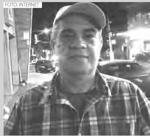
Cabeludo sofreu um mal súbito quando chegava para trabalhar