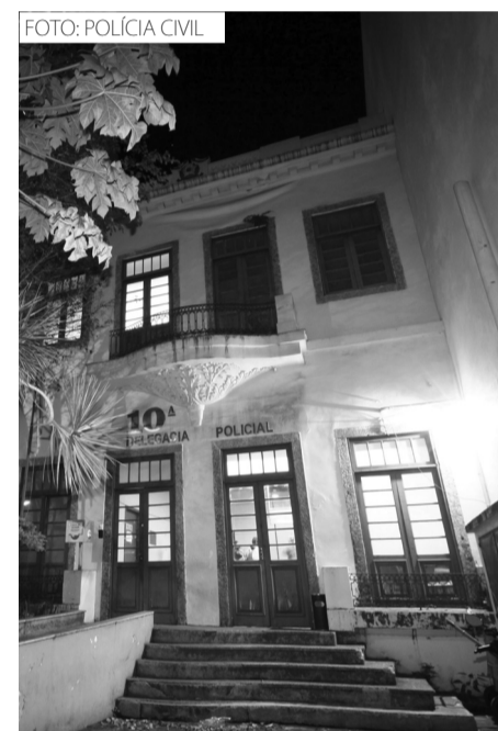
A prisão foi feita por policiais da 10ª DP

Desde setembro, já são mais de 300 presos, além de veículos e cargas recuperados.