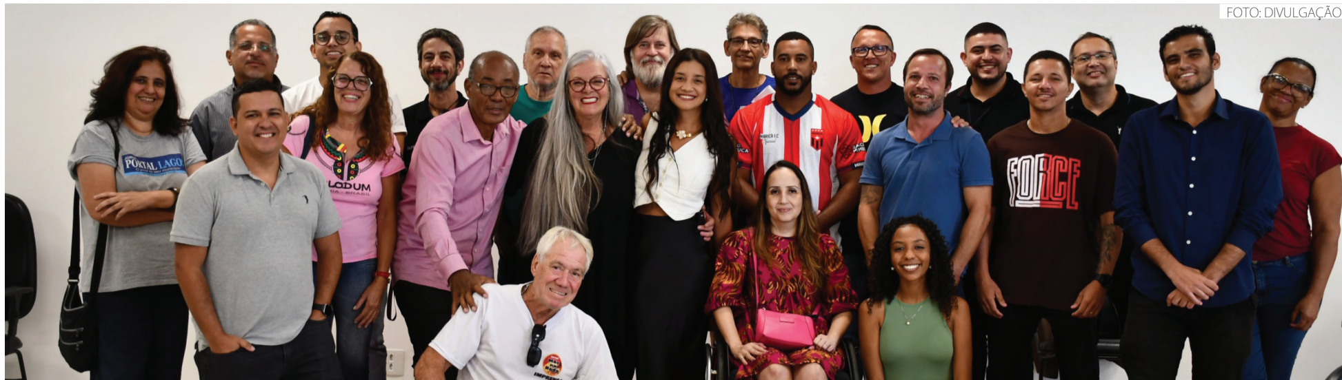
Os novos eleitos ficarão no cargo pelo período de três anos