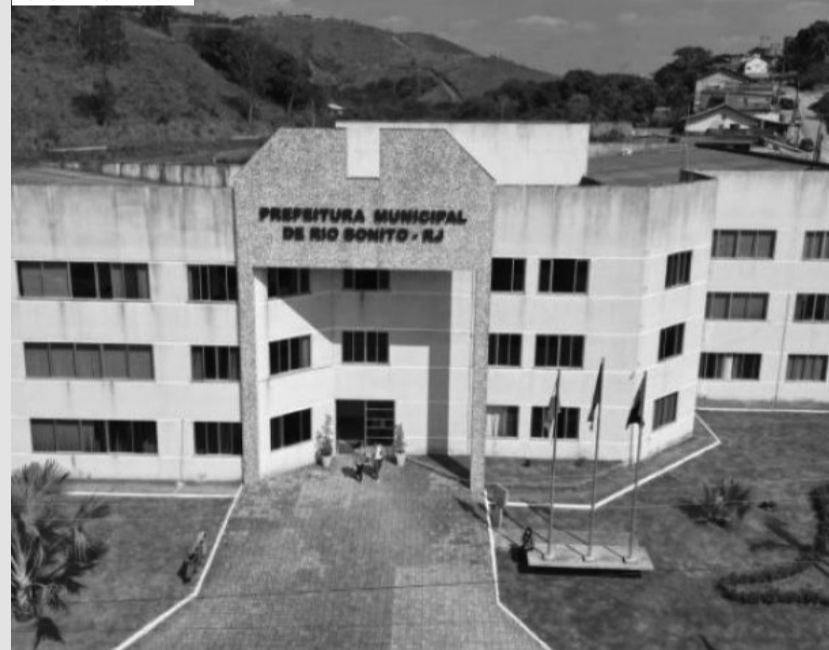
Entre os motivos está a falta de informações durante a transição de governo