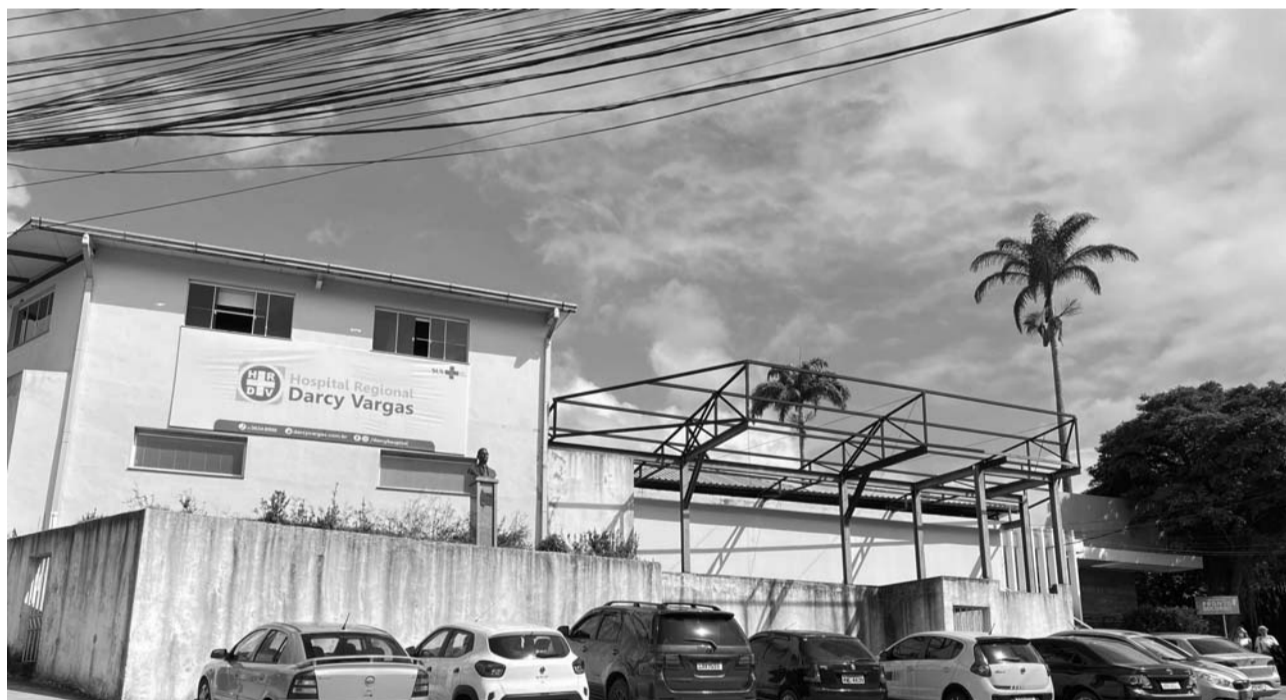
O Hospital Regional Darcy Vargas, localizado em Rio Bonito, está sob intervenção municipal de 2021

briu. O novo presidente fez um vídeo anunciando a reabertura, publicado nas redes sociais da unidade, e disse que o prefeito havia enviado recursos para o reabastecimento do HRDV e consequentemente a reabertura da emergência.