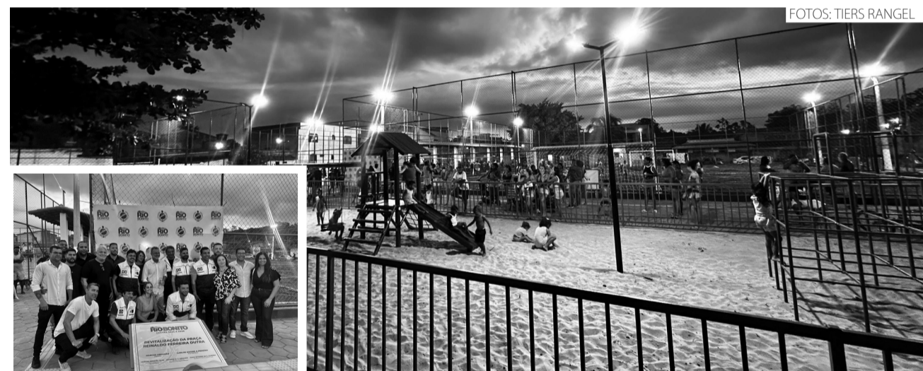
O local ganhou quadra de futevôlei e futsal, parquinho, um campo de grama sintética e outras melhorias

Livia Louzada folhadaterradigital@gmail.com