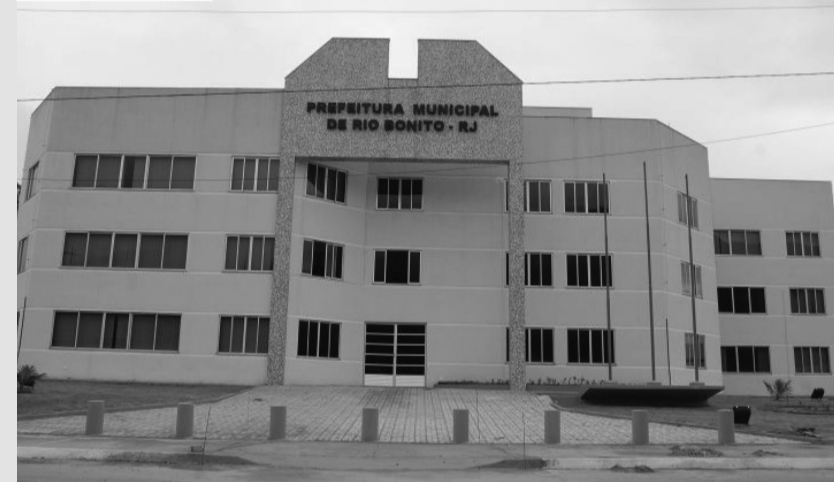
A convocação também se estende aos guardas civis municipais