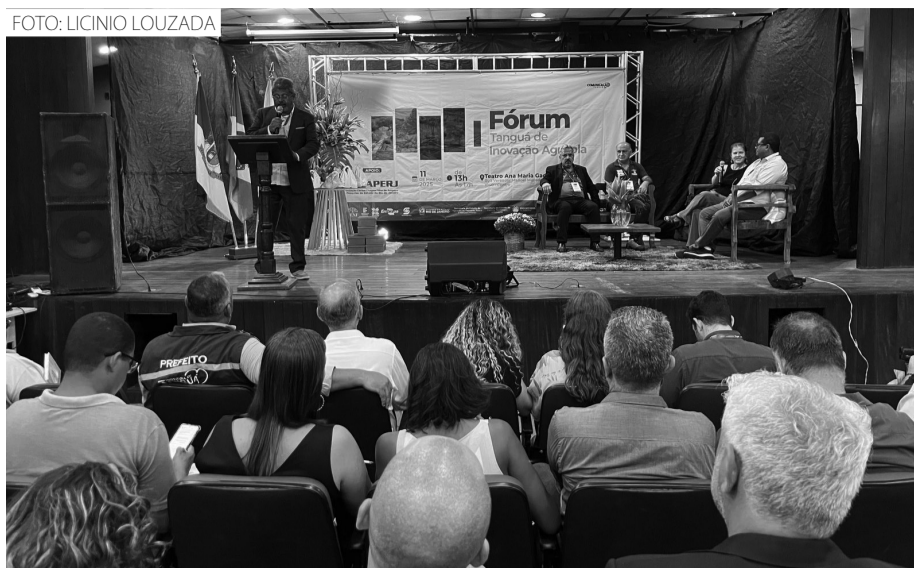
O evento contou com a participação de várias autoridades do setor agrícola