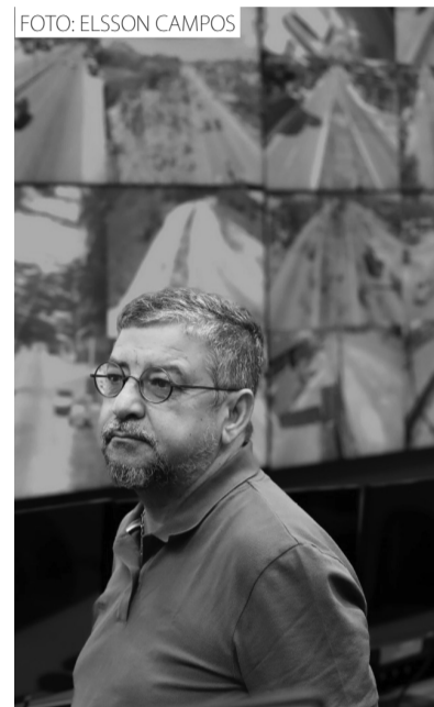
O prefeito Washington Quaquá