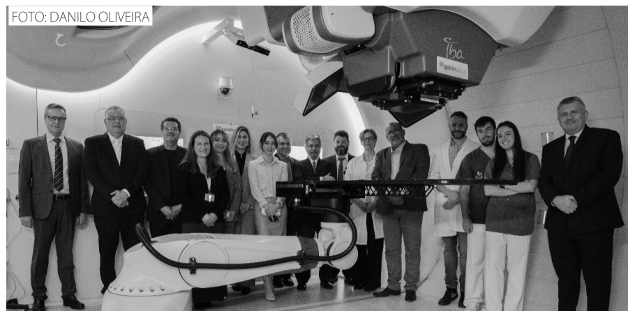
A comissão formada pelos representantes do Brasil e da empresa internacional