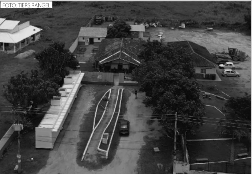
A obra recebeu investimento de R$ 1 milhão do Governo Federal