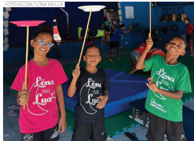
Alunos do Lona na Lua em uma das oficinas oferecidas na cidade

“Meu filho participa de várias oficinas. Ele chega em casa feliz, contando das brincadeiras e das atividades que vivencia aqui. Depois que entrou para o Lona na Lua, o desempenho dele no colégio melhorou totalmente. Ele se tornou mais responsável, mais carismático. A felicidade de participar do projeto transborda. Estou muito satisfeito com