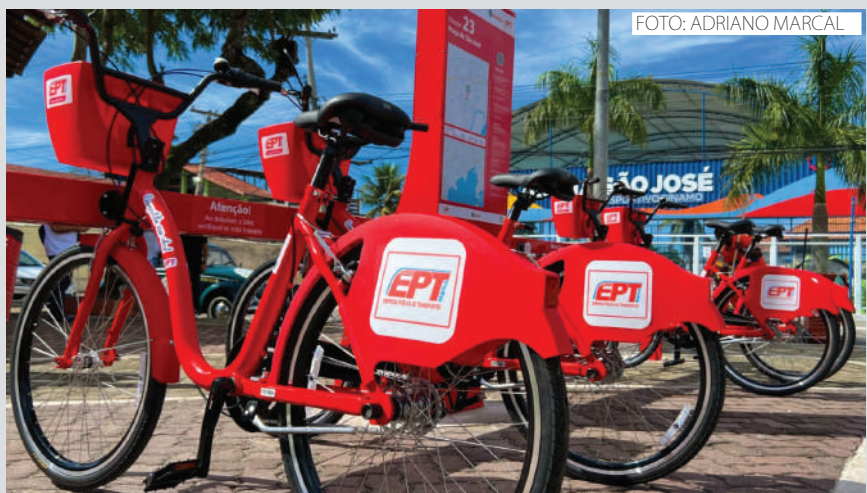
As “Vermelhinhas”, como são conhecidas, são um sucesso na cidade

sistema de mobilidade ativa que integra saúde, sustentabilidade e inclusão. Estar entre os melhores projetos do Brasil em