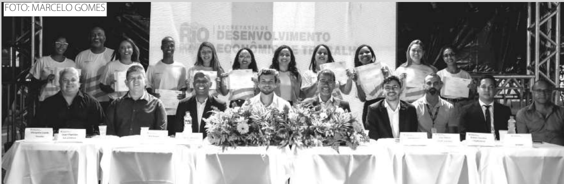
A cerimônia de formatura aconteceu na recém construída praça de alimentação, no Centro da cidade

balho e Desenvolvimento Econômico ampliou a oferta dos cursos e locais das aulas. Além do antigo prédio da Pestalozzi, na Praça Cruzeiro, as aulas também foram realizadas em três escolas municipais: Colégio Municipal Maurício Kopke (Caixa D’Água), Raulbino Mesquita (Basilio) e Kingston Motta (Boa Esperança). A formatura contou com a presença de secretários municipais, vereadores e representantes da Firjan.