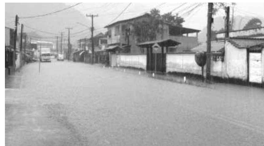
Em Silva Jardim, o volume de chuva, 114mm em 24h, fez com que ruas alagassem