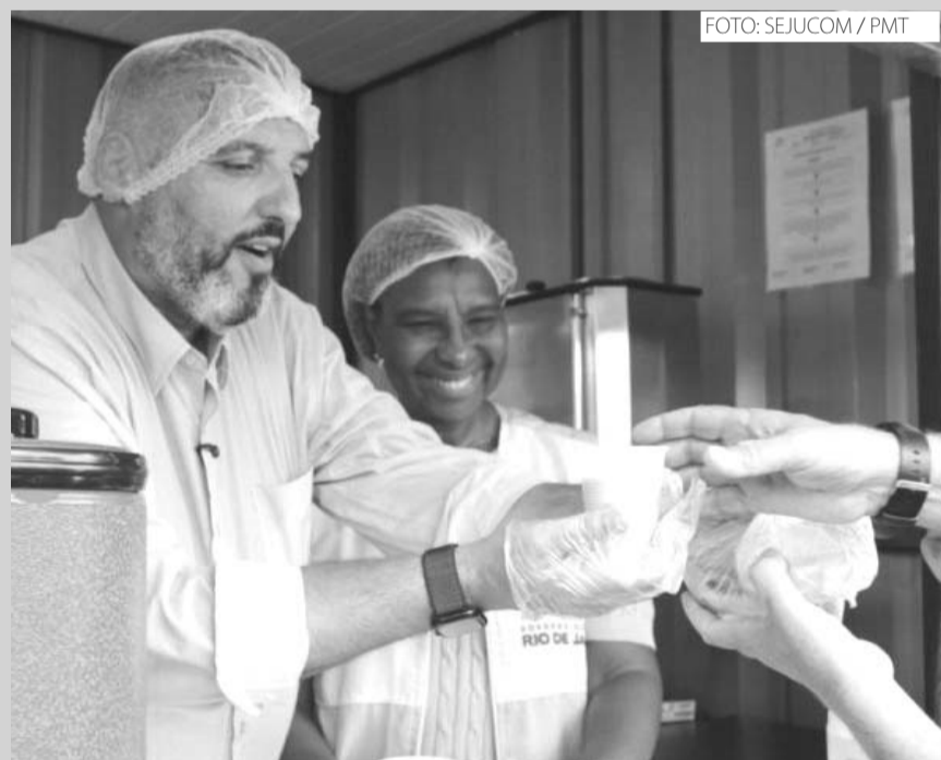
O prefeito Rodrigo Medeiros e a secretária estadual, Rosângela Gomes, distribuem o café da manhã em uma das unidades

Mais dois pontos do Café do Trabalhador foram inaugurados em Tanguá no último dia 5 de fevereiro. Agora, além da unidade no Centro, os tanguenses também contam com espaços em Duques e Bandeirantes II. O primeiro fica localizado ao lado da Igreja Católica do bairro, já o segundo foi posicionado na Praça da Cidadania.