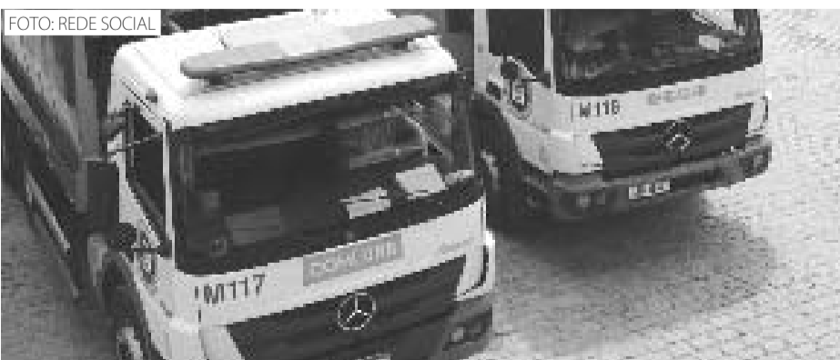
A Prefeitura informou que os caminhões devem reforçar o recolhimento do lixo