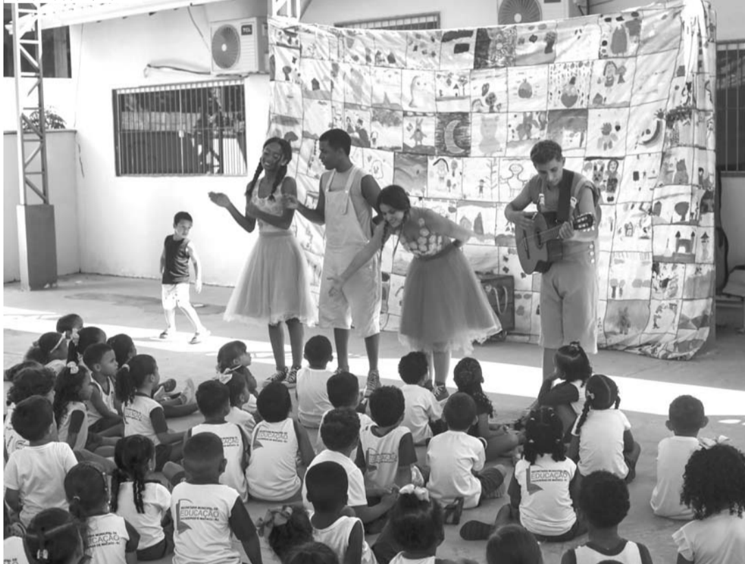
Alunos do Centro de Educação Infantil Municipal Barãozinho, com os olhos atentos na apresentação do espetáculo

O Lona na Lua levou encanto e imaginação ao Centro de Educação Infantil Municipal Barãozinho, em Cachoeiras de Macacu, no último dia 23 de fevereiro. Mais de 100 alunos, com idades entre 2 e 5 anos, assistiram ao espetáculo “A caixa conta”. Com uma proposta lúdica e educativa, o espetáculo tem como foco o incentivo à leitura, apresentando às crianças clássicos da literatura de forma acessível, criativa e envolvente.