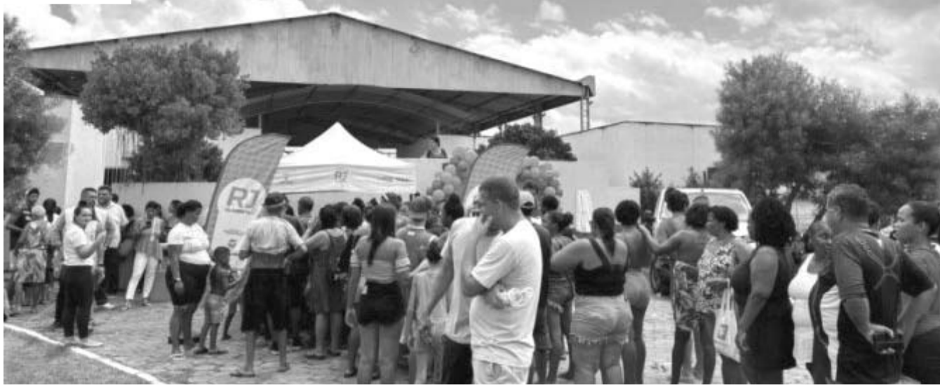
A Praça da Juventude, na Ampliação, é o local escolhido para a distribuição dos alimentos diariamente