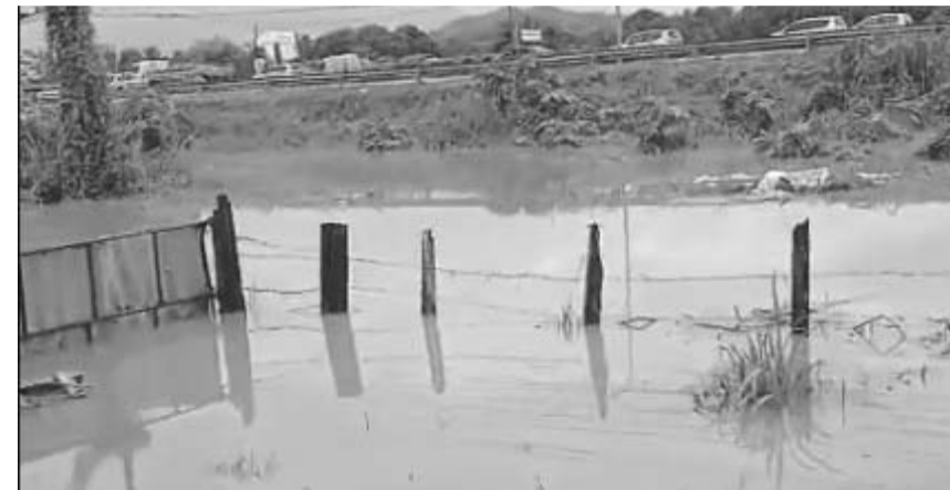
No Pinhão, a entrada de uma casa alagou, impedindo o acesso dos moradores