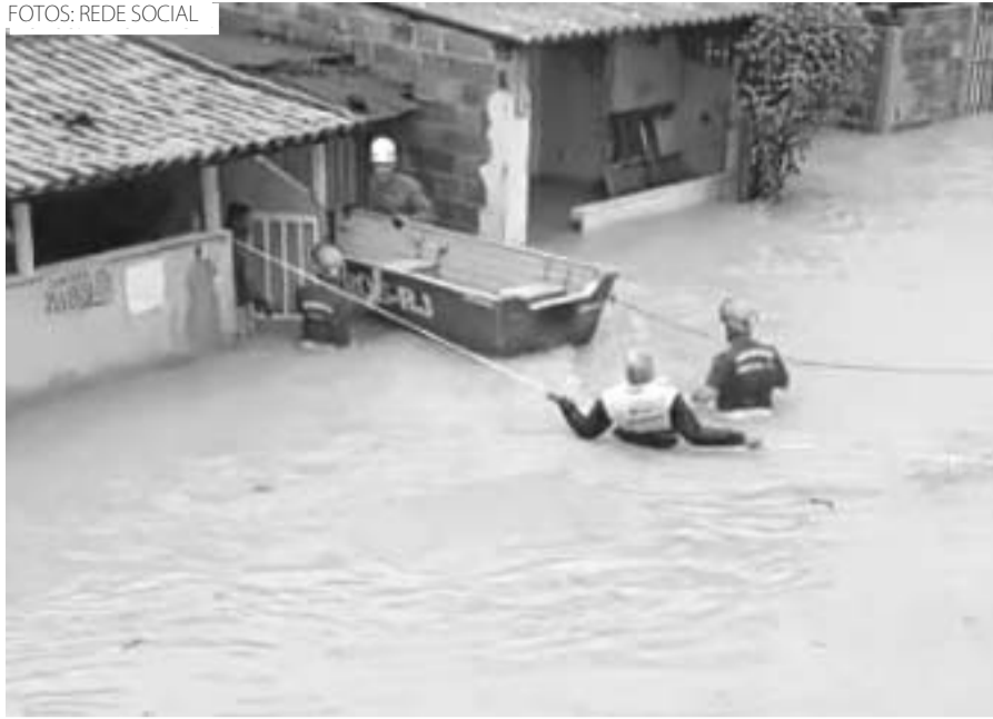
Uma família precisou ser retirada de casa em um barco no Parque das Acácias

tou levantar as coisas, mas a água subiu muito rápido. Em meia hora já estava tudo cheio porque o rio começou a jogar a água para cá”, disse.