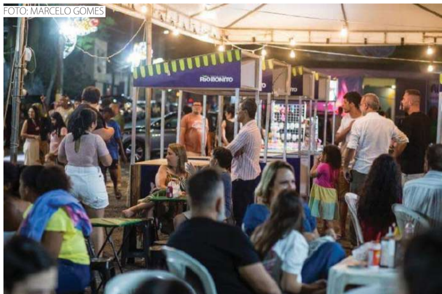
No Centro, os ambulantes ficam concentrados ao lado da Estação dos Sabores

circulação de pedestres e veículos; vender produtos fora da atividade autorizada; ceder ou alugar o ponto; fazer propaganda de terceiros e permanecer com o veículo fora do horário permitido.