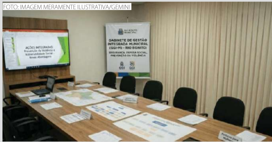
O setor vai funcionar como um grupo de trabalho formado por várias pastas