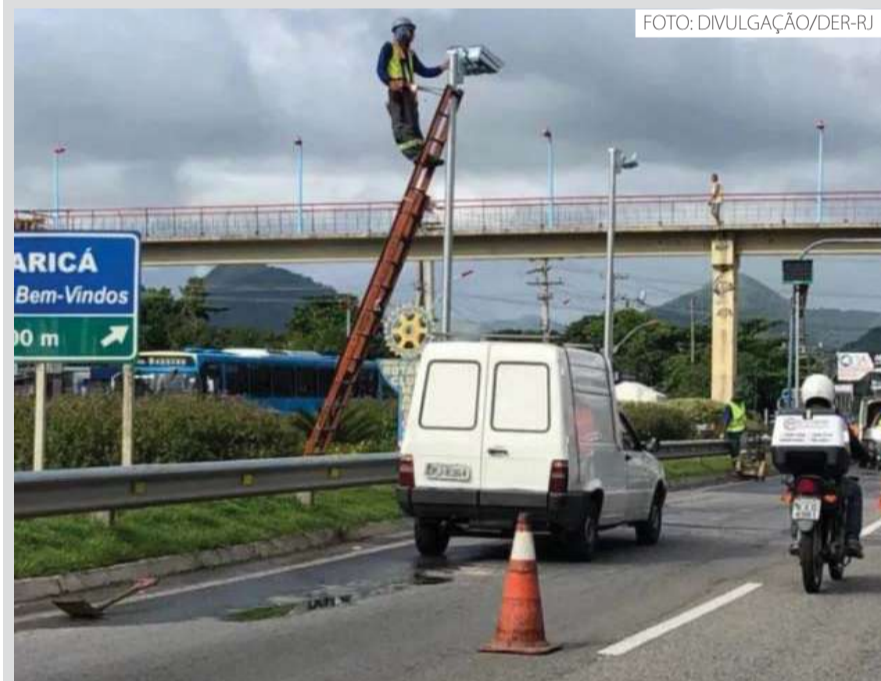
Segundo o DER-RJ, serão instalados 390 radares entre a RJ-116 (Itaboraí/Região Serrana) e a RJ-122 (Guapimirim/Cachoeiras de Macacu)

Clara Egger (Estagiária sob supervisão) folhadaterra@digital@gmail.com