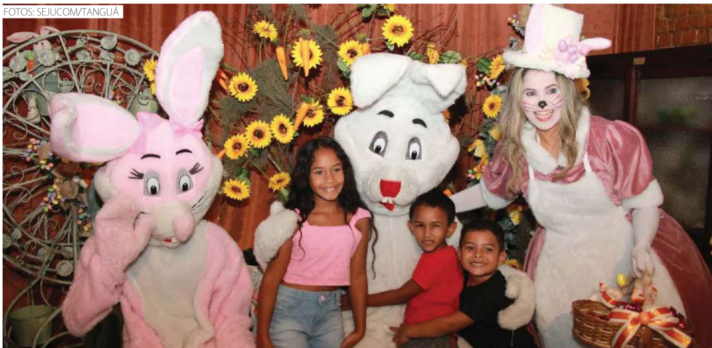
A "Páscoa Encantada" da Prefeitura de Tanguá reuniu famílias inteiras para celebrar a data ao lado dos coelhinhos

Clara Egger (Estagiária sob supervisão) folhadaterra@digital@gmail.com