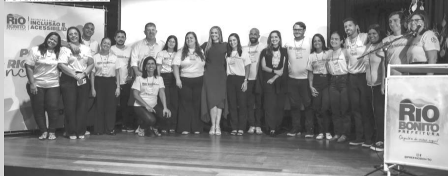
Equipe da secretaria de Inclusão e Acessibilidade que organizou o evento