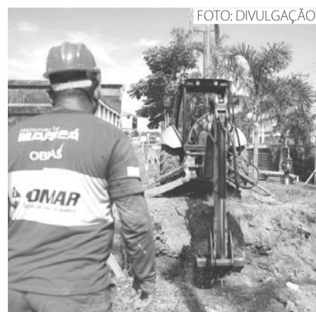
Operários da Somar trabalham na construção da passarela em Ponta Grossa