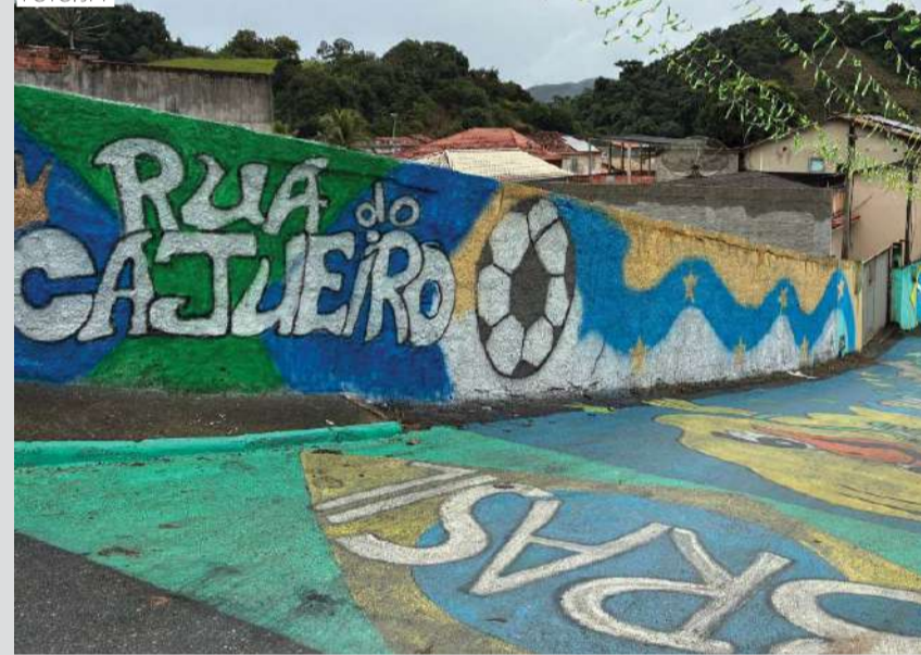
A Rua A, no Cajueiro, foi a grande vencedora do concurso com 86,75 pontos