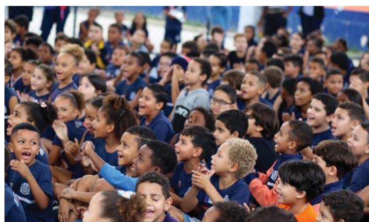
Alunos da Escola Municipal Guilherme de Miranda Saraiva ficaram encantados com a apresentação do Lona na Lua

A magia dos clássicos da literatura infantil tomou conta da Escola Municipal Guilherme de Miranda Saraiva no dia 15/06, em Itaboraí. Centenas de alunos da Educação Infantil ao 5º ano acompanharam a apresentação do espetáculo "Clássicos", que transformou o dia dos estudantes em uma verdadeira viagem por histórias cheias de aventura, fantasia e conhecimento.