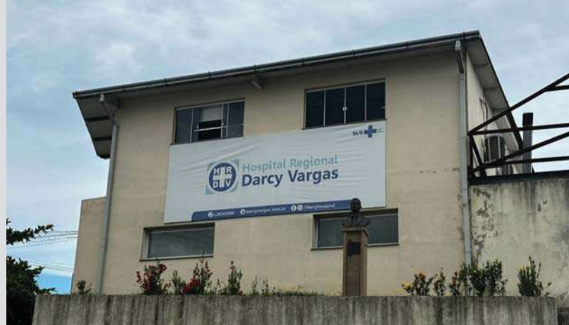
O Hospital Regional Darcy Vargas já está realizando cirurgias pediátricas