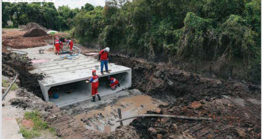
O sistema possui a tecnologia de bueiros inteligentes que identificam as obstruções

Um sistema inteligente para monitorar e prevenir enchentes está sendo implantado em Maricá. A plataforma escolhida foi a Smart Drainage (Drenagem Inteligente, em tradução livre), que conta com bueiros inteligentes que permitirão a identificação rápida de pontos de obstrução, falhas operacionais e gargalos no escoamento das águas pluviais. Segundo a Prefeitura, a iniciativa é resultado de um investimento de R$87,3 milhões.